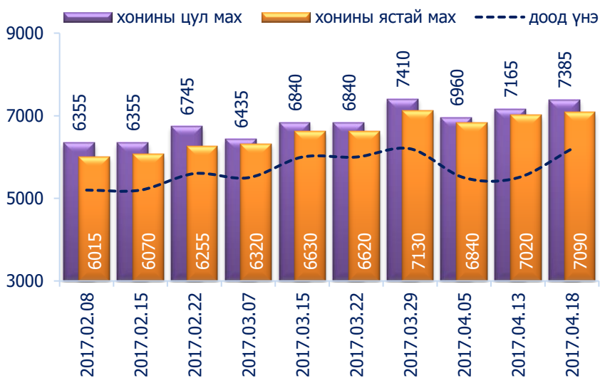
Зураг 2. Хонины 1 кг махны дундаж үнэ, төгрөг

Хонины ястай махны үнэ өмнөх долоо хоногтой харьцуулахад 1.0 хувиар буюу 70 төгрөгөөр, хонины цул махны үнэ 3.1 хувиар буюу 220 төгрөгөөр тус тус өссөн байна. Энэ долоо хоногийн ажиглалтаар хонины мах "Хархорин" хүнсний захад хамгийн хямд буюу 6200 төгрөгөөр, харин "Меркури", "Таван-Эрдэнэ" хүнсний захуудад хамгийн өндөр үнэтэй буюу 8000 төгрөгөөр худалдаалж байна.