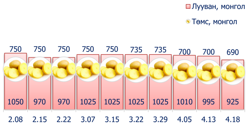
Зураг 5. Нэг кг хүнсний ногооны дундаж үнэ, төгрөг

2017 оны 4-р сарын 3-р долоо хоногт өмнөх долоо хоногтой харьцуулахад хүрэн манжин 0.3 хувиар буюу 5 төгрөгөөр өсч, харин монгол төмс 1.4 хувиар буюу 10 төгрөг, лууван 7.0 хувиар буюу 70 төгрөгөөр тус тус буурсан байна.