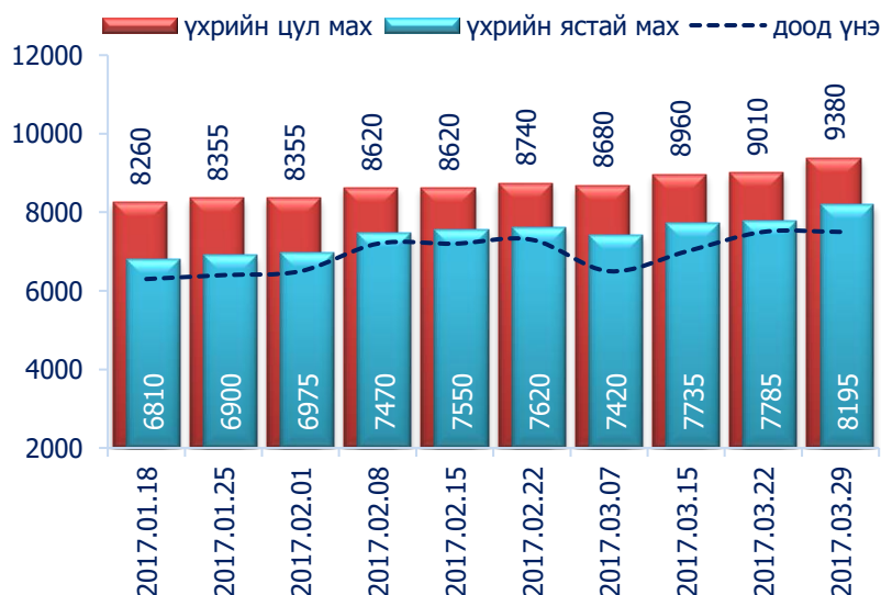
Зураг 1. Үхрийн 1 кг махны дундаж үнэ, төгрөг

2017 оны 3-р сарын 4-р долоо хоногт хонины ястай нэг килограмм мах дунджаар 7130 төгрөг, үхрийн ястай мах нэг килограмм нь дунджаар 8195 төгрөгийн үнэтэй байна. Үхрийн ястай махны үнэ өмнөх долоо хоногтой харьцуулахад 5.3 хувиар буюу 410 төгрөгөөр, үхрийн цул махны үнэ 4.1 хувиар буюу 370 төгрөгөөр тус тус өссөн байна. Энэ 7 хоногийн ажиглалтаар үхрийн мах "Баянзүрх" хүнсний захад хамгийн хямд буюу 7500 төгрөг, харин "Таван-Эрдэнэ" хүнсний захад хамгийн өндөр үнэтэй буюу 9000 төгрөг байна.