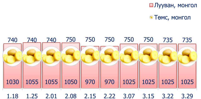
Зураг 5. Нэг кг хүнсний ногооны дундаж үнэ, төгрөг

2017 оны 3-р сарын 4-р долоо хоногт өмнөх долоо хоногтой харьцуулахад байцаа 1.0 хувиар буюу 20 төгрөгөөр буурсан байв.