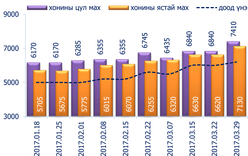
Зураг 2. Хонины 1 кг махны дундаж үнэ, төгрөг

Хонины ястай махны үнэ өмнөх долоо хоногтой харьцуулахад 7.7 хувиар буюу 510 төгрөгөөр, хонины цул махны үнэ 8.3 хувиар буюу 570 төгрөгөөр өссөн байлаа. Энэ долоо хоногийн ажиглалтаар хонины мах "Баянзүрх" хүнсний захад хамгийн хямд буюу 6200 төгрөгөөр, харин "Меркури", "Таван-Эрдэнэ" хүнсний захуудад хамгийн өндөр үнэтэй буюу 8000 төгрөгөөр худалдаалж байна.