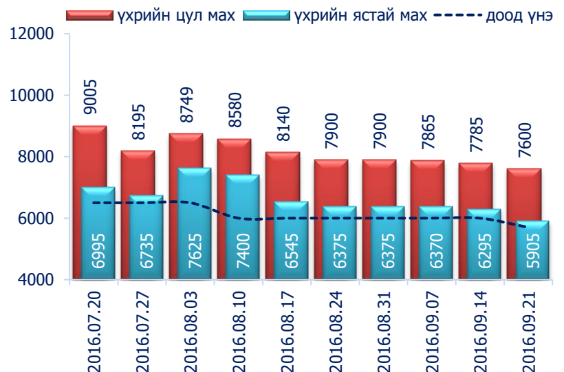
Зураг 1. Үхрийн 1 кг махны дундаж үнэ, төгрөг

2016 оны 9-р сарын 3-р долоо хоногт хонины ястай нэг килограмм мах дунджаар 4870 төгрөг, үхрийн ястай мах нэг килограмм нь дунджаар 5905 төгрөгийн үнэтэй байна. Үхрийн ястай махны үнэ өмнөх долоо хоногтой харьцуулахад 6.2 хувиар буюу 390 төгрөг, үхрийн цул мах 2.4 хувиар буюу 185 төгрөгөөр буурсан байна. Энэ 7 хоногийн ажиглалтаар үхрийн мах "Хүчит Шонхор" хүнсний захад хамгийн хямд буюу 5700 төгрөг, харин "Меркури" хүнсний захад хамгийн өндөр үнэтэй буюу 7500 төгрөг байна.