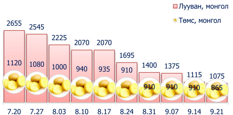
Зураг 5. Нэг кг хүнсний ногооны дундаж үнэ, төгрөг

2016 оны 9-р сарын 3-р долоо хоногт өмнөх долоо хоногтой харьцуулахад монгол төмс 4.9 хувиар буюу 45 төгрөгөөр, лууван 3.6 хувиар буюу 40 төгрөгөөр, манжин 14.4 хувиар буюу 210 төгрөгөөр тус тус буурсан байна.