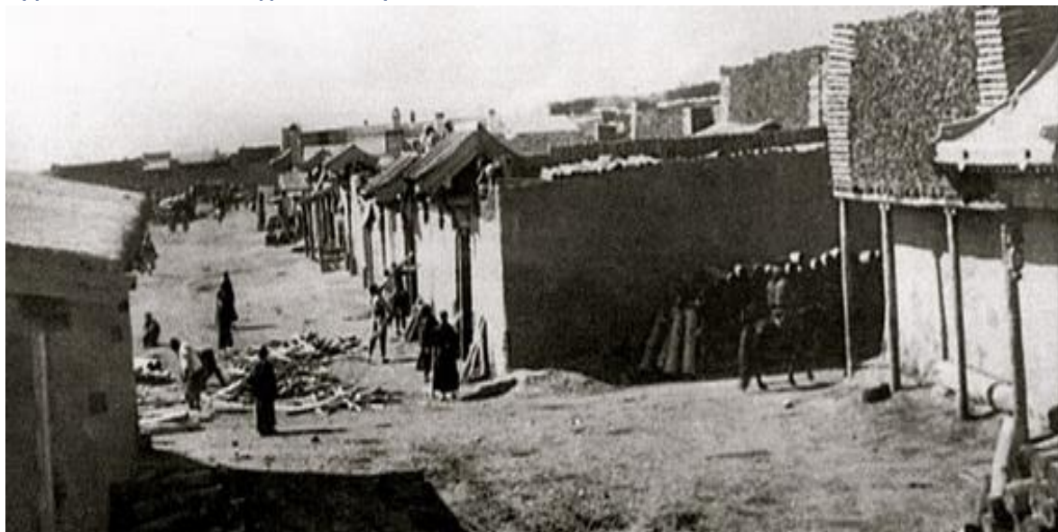
Зураг 8. Нийслэл хүрээний гудамж, 1911 он

1919 онд Сю Шүженээр толгойлуулсан хятад цэрэгт Нийслэл хүрээ эзлэгдсэн ба 1921 оны 2-р сард Барон Унгернээр толгойлуулсан цагаан цэргүүд хятад цэргээс Нийслэл хүрээг чөлөөлж, Богдыг дахин хаан ширээнд залсан юм. 1921 оны 3-р сард монгол цэргүүд улаан оросын цэргүүдтэй хамтран Хиагтыг, 6-р сард Нийслэл хүрээнээс цагаантнуудыг цохин дутаалгаснаас хойш нийслэл нь гадаадын цэргийн түрэмгийллээс чөлөөлөгдсөн.