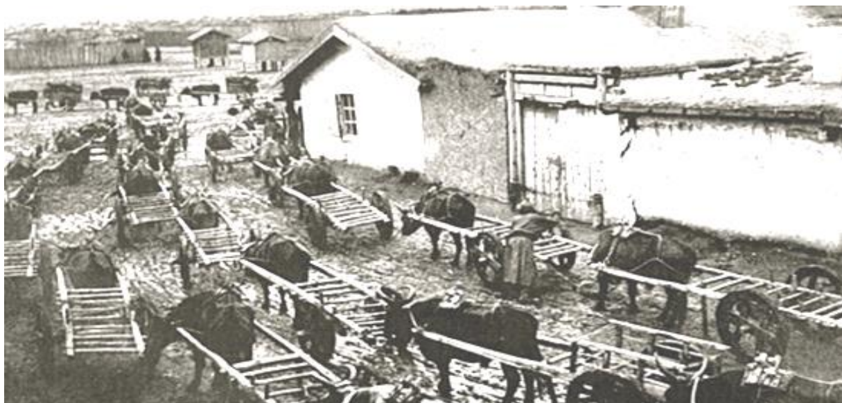
Зураг 6. Нийслэл хүрээний зах, 1911 он

Зүүн хүрээний гол хийдийн өмнө талд цамын том талбай, хүрээг тойрон Майдар эргэхэд зориулсан тусгай зам, хийдийн өмнө ёслолын хаалга байх бөгөөд түүний дэргэд олон тооны модон хүрд эгнүүлж, мөргөлчин сүсэгтэн олон түмэн сунаж мөргөхөд зориулсан модон давцантай байжээ.