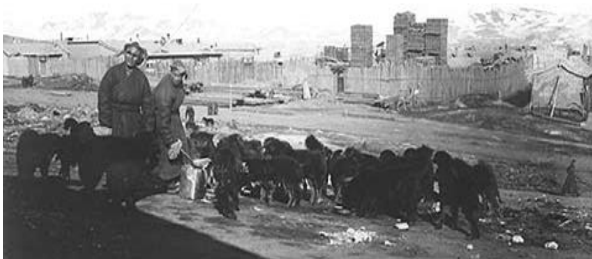
Зураг 7. Нийслэл хүрээний малын зах, 1911 он

Гол талбайн хойно Дэчингалавын сүм, Их Цогчин дуган, баруун талд нь 1833 онд бариулсан Майдар сүм, Абтай хааны Өргөө буюу Баруун Өргөө байрлаж байв. Зүүн хүрээний баруун, зүүн жигүүрт зурхайн дацан, Жүдийн дацан, эмчийн дацан, Маналын дуган зэрэг бурхан шашны болон аж ахуйн засаг, захиргааны барилга, байгууламжууд байрлаж байв. Гандан хийдэд нийтдээ 6000 лам нар сууж байв.