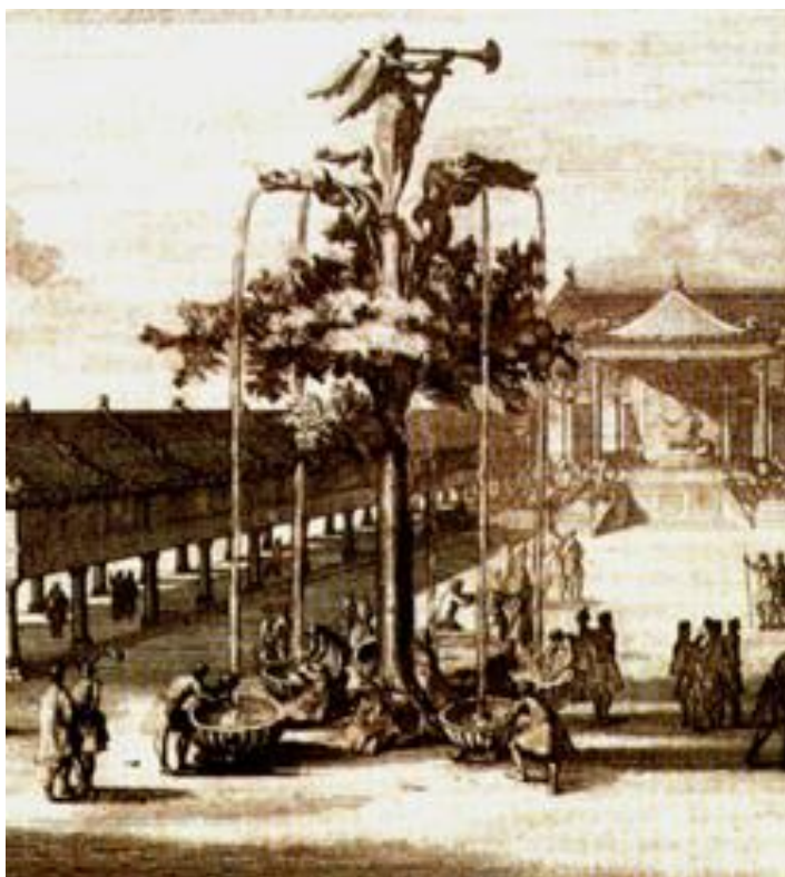
Зураг 2. Их Монгол улсын нийслэл Хар хорум хот 1222-1380 он

Их Монгол Улсын анхны нийслэл Хархорум хот нь Орхон голын хөндийд цогцолсон ба Юань улс нуран унасны дараа Мин улсын довтолгоонд хоёронтой (1380, 1410 он) галдан шатаагджээ.