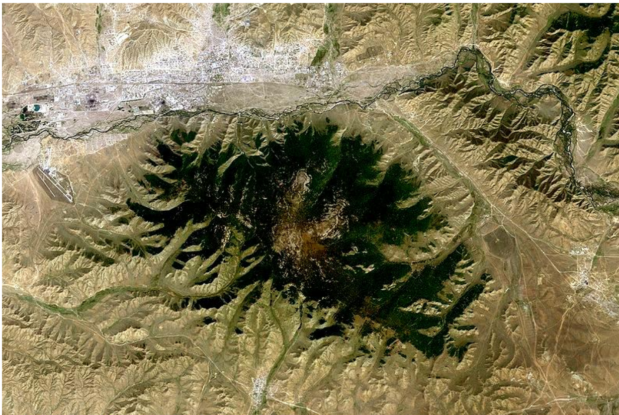
Зураг 1. Богд Хан уул

Сансараас авсан зургийн төвд Богд хан уул оршино. Баруун хойд буланд нь Улаанбаатар хот харагдах бөгөөд Туул гол хот, уул хоёрын хооронд урсана. Өмнө талд нь Зуунмод, зүүн талд нь Налайх, баруун талд нь Чингис хаан олон улсын нисэх онгоцны буудал байрладаг.