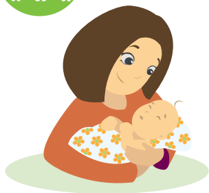
Амаржсан эхийн тоо