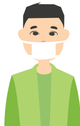
Халдварт өвчнөөр өвчилсэн хүний тоо