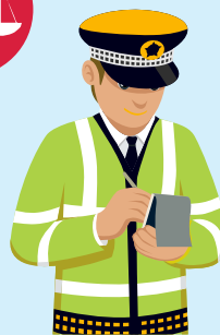
Бүртгэгдсэн гэмт хэргийн тоо