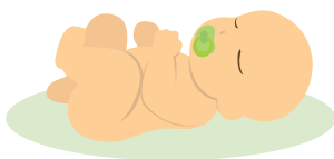
Төрсөн хүүхдийн тоо