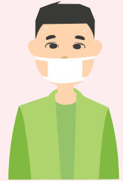
Халдварт өвчнөөр өвчилсэн хүний тоо