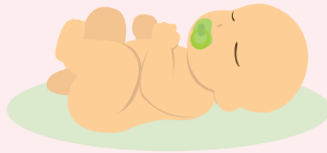
Төрсөн хүүхдийн тоо