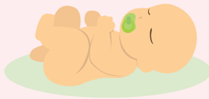
Төрсөн хүүхдийн тоо