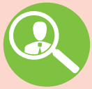
Бүртгэлтэй ажилгүй иргэдийн тоо