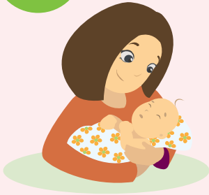
Амаржсан эхийн тоо