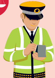
Бүртгэгдсэн гэмт хэргийн тоо