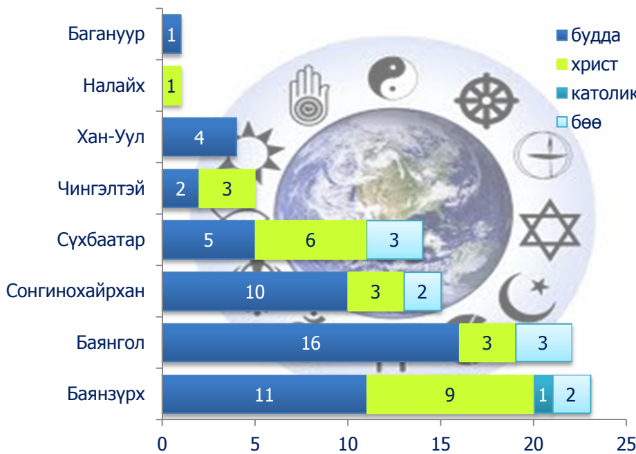
Зураг 4. Зөвшөөрлийн хугацаа нь дууссан сүм хийд, дүүргээр

2011 оны жилийн эцсийн байдлаар НИТХ-ын Тэргүүлэгчдийн тогтоолд заасан шашны үйл ажиллагаа явуулах зөвшөөрлийн хүчинтэй байх хугацаа нь дууссан 85 сүм хийд байна. Тэдгээрийн 57.6 хувь нь буддын, 29.4 хувь нь христийн, 11.8 хувь нь бөөгийн, 1.2 хувь нь католик шашин байгаа бөгөөд олонх нь Баянзүрх, Баянгол, Сонгинохайрхан, Сүхбаатар дүүрэгт бүртгэлтэй ажээ.