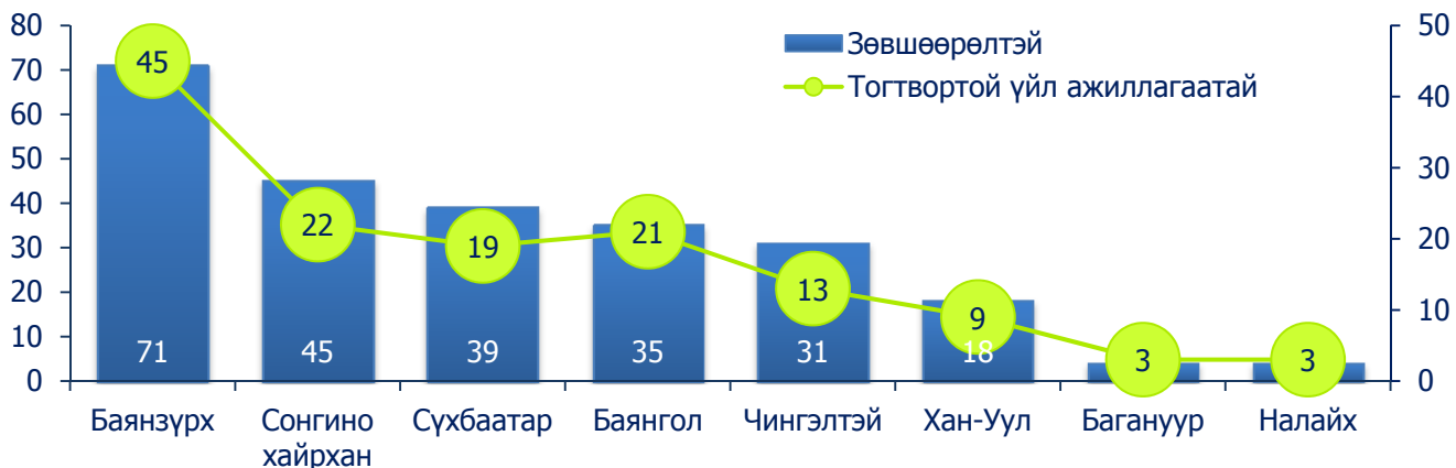
Зураг 1. Тогтвортой үйл ажиллагаа явуулж буй сүм хийд, дүүргээр, 2011 оны эцэст

Нийслэлийн нутаг дэвсгэрт шашны үйл ажиллагаа явуулах албан ёсны зөвшөөрөлтэй нийт сүм хийдээс 135 нь буюу 54.7 хувь нь 2011 онд “тогтвортой үйл ажиллагаа” явуулжээ. Ийнхүү тогтвортой үйл ажиллагаа явуулсан гурван сүм хийд тутмын нэг нь нийслэлийн Баянзүрх дүүрэгт ногдож байгаа юм. Өөрөөр хэлбэл, Баянзүрх дүүрэгт бүртгэгдсэн нийт сүм хийдийн 63.4 хувь, Баянгол дүүргийн 60.0 хувь, Хан-Уул дүүргийн 50.0 хувь, Сонгинохайрхан дүүргийн 48.9 хувь, Сүхбаатар дүүргийн 48.7 хувь, Чингэлтэй дүүрэгт бүртгэлтэй сүм хийдийн 41.9 хувь нь тогтвортой үйл ажиллагаа эрхэлсэн гэсэн үг юм.