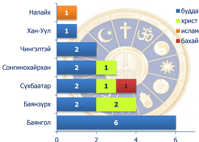
Зураг 3. “Байнга”-ын үйл ажиллагаатай сүм хийд, дүүргээр

Нийслэлд шашны үйл ажиллагаа явуулах албан ёсны зөвшөөрөлтэй 247 сүм хийдийн 8.5 хувь буюу 21 сүм хийдийн зөвшөөрлийн хүчинтэй хугацаа байнга байхаар тогтоогдсон байдаг. Ийм зөвшөөрөлтэй сүм хийдийн тоо 1990-ээд оны сүүл үе гэхэд нийтдээ 28 байсан боловч явцын дунд 7 сүм хийдийн зөвшөөрлийн хугацаанд өөрчлөлт орж, эдгээрээс 6 сүм хийдийн зөвшөөрлийн хугацаа нэг жил (Бэтүб хийдээс бусад)