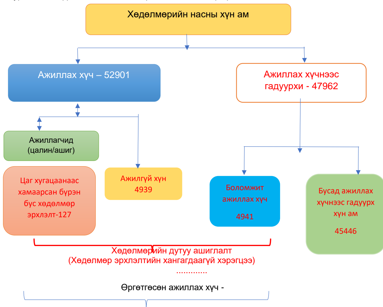
Зураг 1. 15, түүнээс дээш насны хүн амын хөдөлмөр эрхлэлтийн байдал, 2021