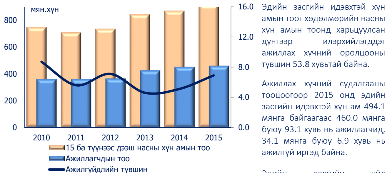
Зураг 1. Хүн амын хөдөлмөр эрхлэлт

Эдийн засгийн идэвхтэй хүн амын тоог хөдөлмөрийн насны хүн амын тоонд харьцуулсан дүнгээр илэрхийлэгддэг ажиллах хүчний оролцооны түвшин 53.8 хувьтай байна.