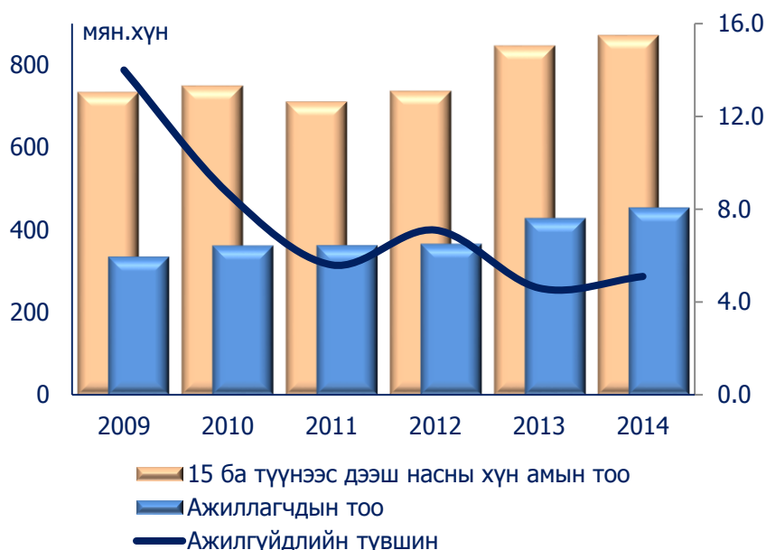
Зураг 1. Хүн амын хөдөлмөр эрхлэлт

Эдийн засгийн идэвхтэй хүн амын тоог хөдөлмөрийн насны хүн амын тоонд харьцуулсан дүнгээр илэрхийлэгддэг ажиллах хүчний оролцооны түвшин 54.7 хувьтай байна.