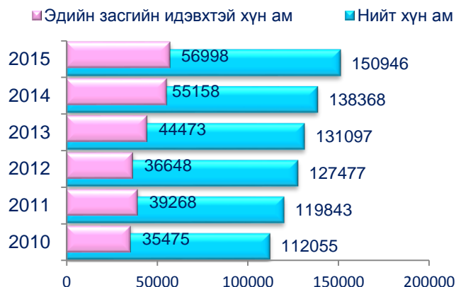
Хүснэгт 5. Ажиллагчдын тоо, хөдөлмөр эрхлэлтийн статусаар, нийслэлд эзлэх хувиар