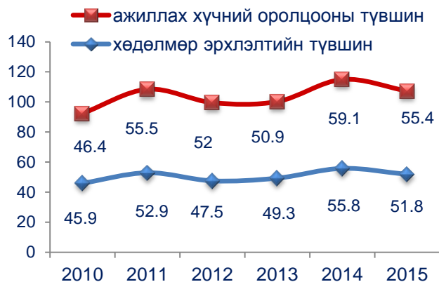
Зураг 2. Хөдөлмөр эрхлэлтийн түвшин, ажиллах хүчний оролцооны түвшин