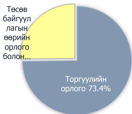
Зураг 3. Татварын бус орлогын бүтэц, хувиар