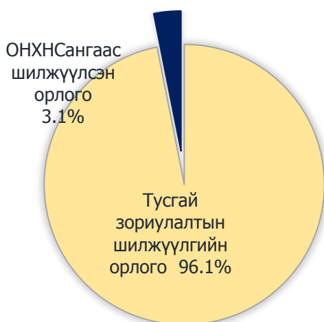
Зураг 4. Тусламжийн орлогын бүтэц, хувиар