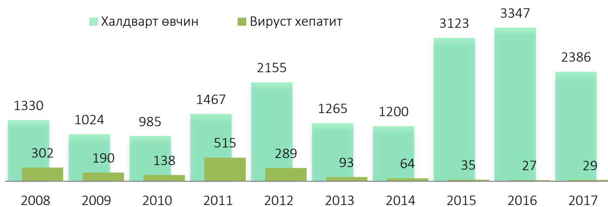
Зураг 2. Халдварт өвчин, вирус хепатит, 2008-2017 он