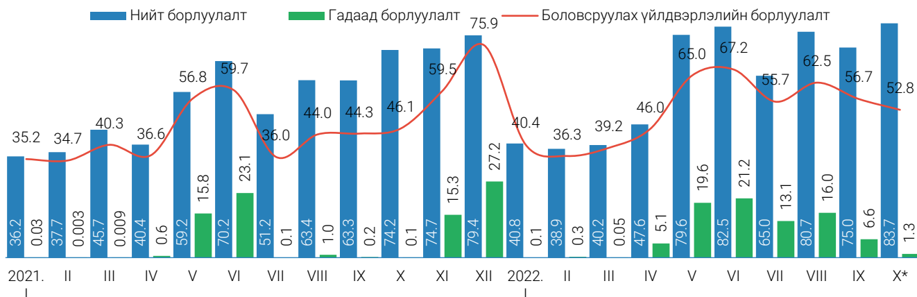
ЗУРАГ 2. АЖ ҮЙЛДВЭРИЙН САЛБАРЫН НИЙТ БОРЛУУЛАЛТ, сараар, тэрбум төгрөг

2022 оны эхний 10 сарын байдлаар нийт борлуулсан бүтээгдэхүүний 83.4 тэрбум төгрөг буюу 13.2 хувийг гадаадын зах зээлд борлуулжээ. Гадаад зах зээлд борлуулсан нийт бүтээгдэхүүнийг боловсруулах үйлдвэрлэлийн ээрэх, нэхэх, даавуун материал бэлтгэх бүтээгдэхүүн эзэлж байна.