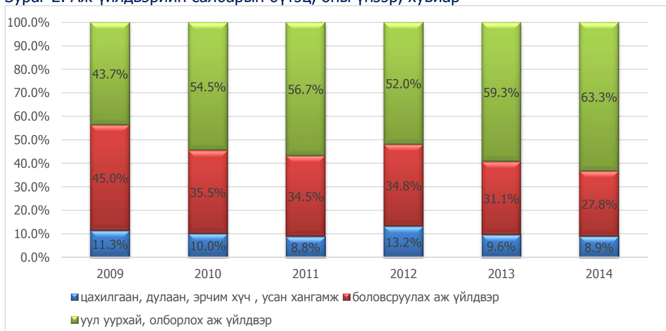
Зураг 2. Аж үйлдвэрийн салбарын бүтэц, оны үнээр, хувиар

Төмрийн хүдэр олборлолт, газрын тос, шатдаг хий олборлолт, бусад ашигт малтмалын олборлолтын үйлдвэрийн нийт үйлдвэрлэлт, мөн үр тарианы гурил, малын тэжээлийн үйлдвэрлэл, ундаа, сүү, сүүн бүтээгдэхүүн үйлдвэрлэл, резинэн болон хуванцар бүтээгдэхүүн, тамхи, нэхмэлийн үйлдвэрлэл, арьс шир боловсруулах үйлдвэрлэл, цахилгаан хэрэгсэл, кокс үйлдвэрлэл, төмөрлөг бус эдлэлийн үйлдвэрлэл, эмнэлгийн багаж, хэмжүүр үйлдвэрлэл, мебель тавилга үйлдвэрлэл, цахилгаан хэрэгсэл үйлдвэрлэл, машин төхөөрөмжөөс бусад төмөр үйлдвэрлэлүүд 2.8 хувиас 4.2 дахин өссөн нь нийт үйлдвэрлэлтийн өсөлтөд нөлөөлсөн байна.