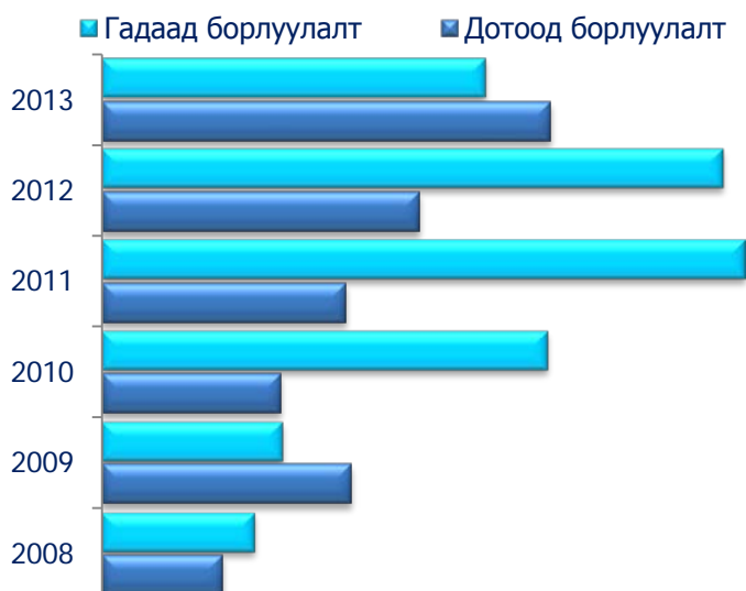
Зураг 3. Дүүргийн гадаад, дотоод борлуулалт, 2008-2013 он

Нийслэлийн аж үйлдвэрийн нийт борлуулалтын 13.8 хувийг Баянзүрх дүүргийн аж үйлдвэрийн салбарын борлуулалт эзэлж байна. Сүүлийн 6 жилийн борлуулалтаас харахад 2008-2012 онуудад өссөн үзүүлэлттэй байна.